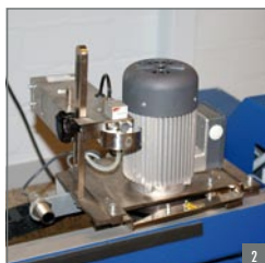
2. Snij- en markeerunit

Eisenkolb heeft zich ontwikkeld tot marktleider in de gordijnverwerkende industrie. Als totaaloplosser bieden we u een ongekennde expertise en ondersteunende dienstverlening op basis van technisch superieure machines en materialen.