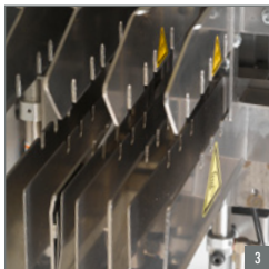
1. Microflex gordijnhaak