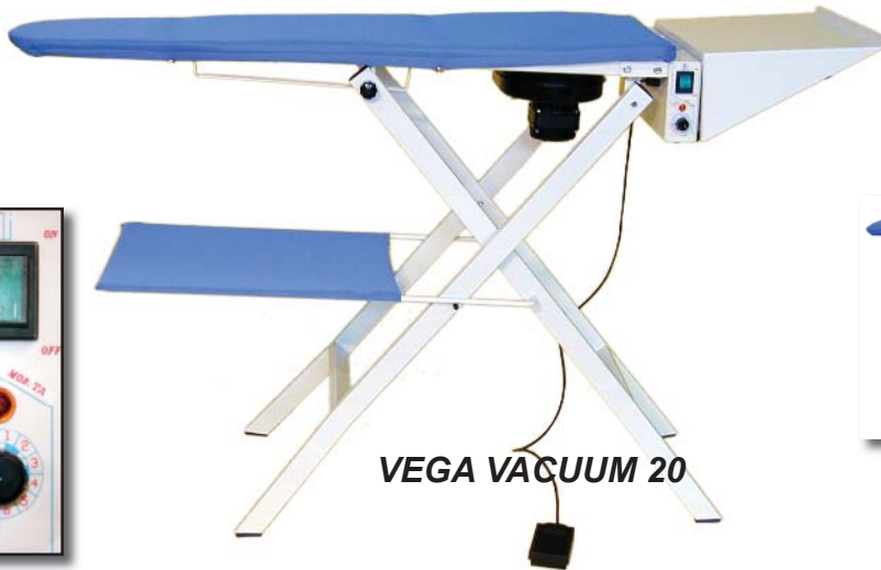
VEGA VACUUM 20