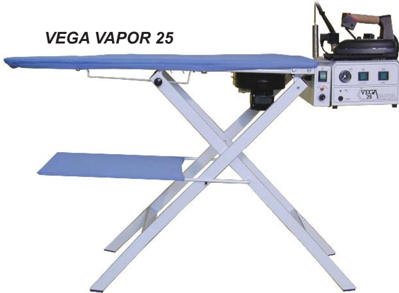
VEGA VAPOR 25