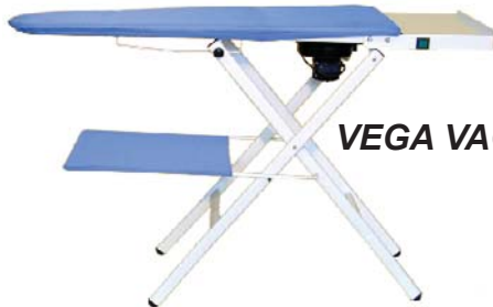
VEGA VACUUM 10